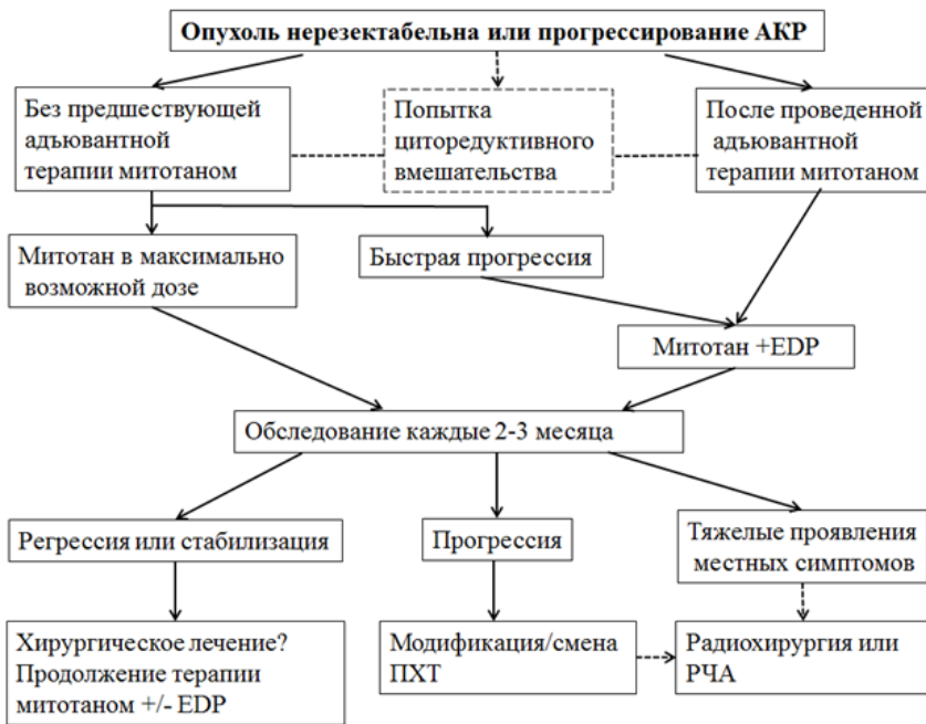
Рисунок 2. Алгоритм лечения при нерезектабельном или прогрессирующем АКР