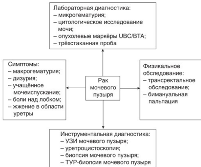
Рисунок 2. Схема уточняющей диагностики рака мочевого пузыря