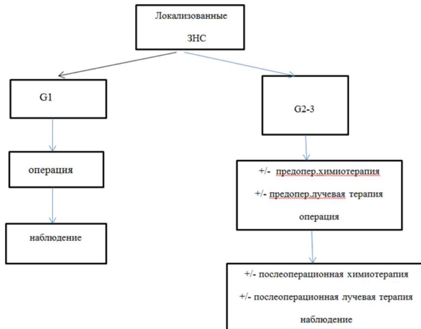
Рис. 1. Схема лечения пациентов с локализованными забрюшинными неорганными саркомами